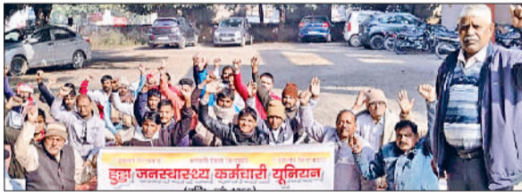
बहादुरगढ़। मांगों को लेकर नारेबाजी करते कर्मचारी।