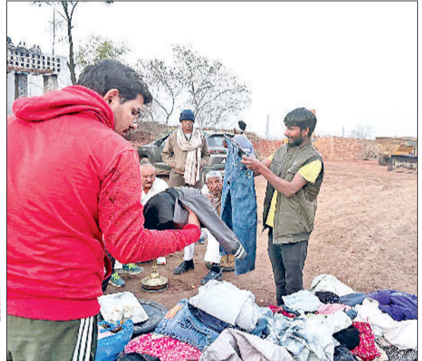
झज्जर। ईट भट्टे पर किए गए कपड़ा वितरण के दौरान गर्म कपड़े छंटते हुए जरूरतमंद श्रमिक।