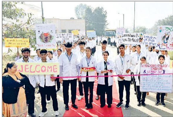
झज्जर। कुष्ठ रोग पर आयोजित कार्यक्रम में उपस्थित नर्सिंग छात्राएं।