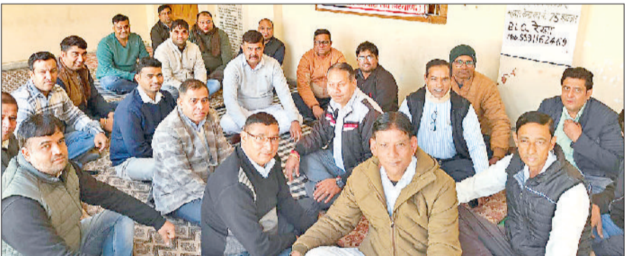
झज्जर। पटवार भवन में धरने पर पटवारियों ने मांगों को लेकर की नारेबाजी।