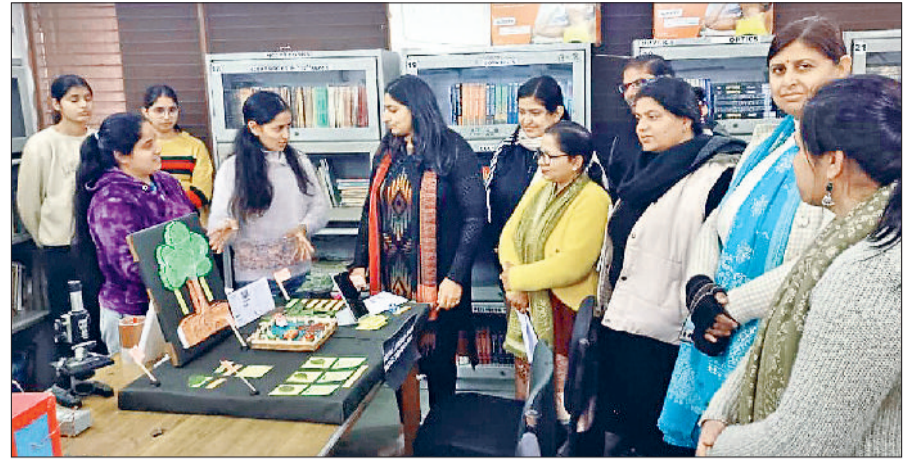
झज्जर। विद्यार्थियों द्वारा तैयार मॉडल के बारे में जानकारी लेते हुए शिक्षक।