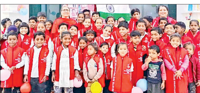
बहादुरगढ़। मंथन केंद्र में पढ़ने वाले विद्यार्थी।

कॉन्फेडरेशन ऑफ बहादुरगढ़ इंडस्ट्रीज द्वारा दिव्य ज्योति जागृति संस्थान के सहयोग से गणपति धाम स्थित एकेएम टावर में मंथन सम्पूर्ण विकास केंद्र का संचालन किया जा रहा है। केंद्र पिछले डेढ़ साल से आर्थिक रूप से कमजोर श्रमिकों के बच्चों को कक्षा पांचवीं तक निशुल्क शिक्षा प्रदान कर रहा है।