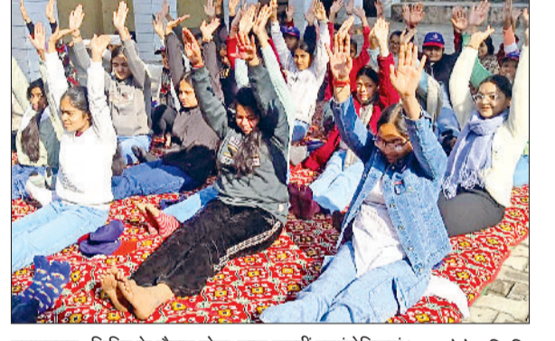
बहादुरगढ़। शिविर के दौरान योगाभ्यास करती स्वयंसेविकाएं।

वैश्य आर्य कन्या महाविद्यालय की एनएसएस इकाई के विशेष शिविर का तीसरा दिन