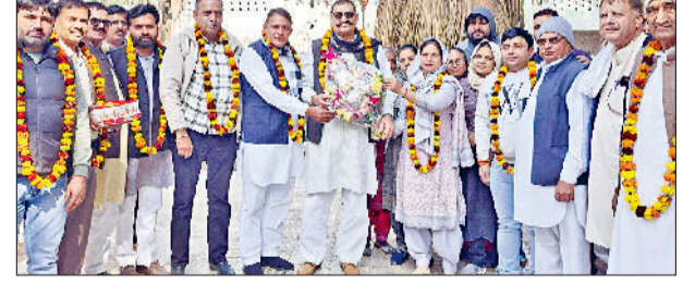
बहादुरगढ़। पूर्व विधायक के साथ नवनि्युक्त पदाधिकारी व अन्य।