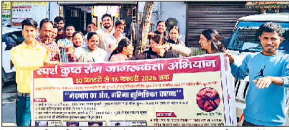
झज्जर। यूपीएचसी सीताराम गेट में कुष्ठ रोग जागरूकता संबंधी शपथ लेते युवा।