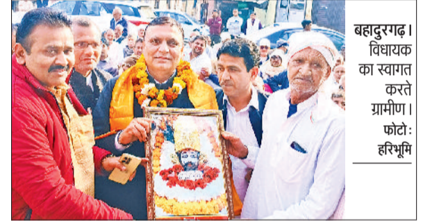
बहादुरगढ़। विधायक का स्वागत करते ग्रामीण।

गांव कसार में निर्माणाधीन श्याम बाबा मंदिर में हरियाणवी सांग उत्सव आयोजित