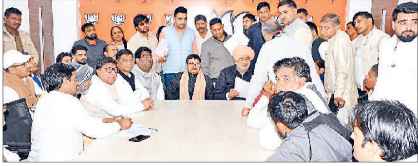
झज्जर। कार्यकर्ताओं से संवाद करते हुए कैबिनेट मंत्री श्याम सिंह राणा।

कार्यकर्ताओं से केंद्र और प्रदेश सरकार की जनकल्याणकारी योजनाओं व नीतियों को घर-घर तक पहुंचाने का आह्वान किया