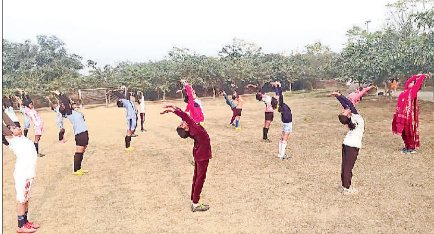
झज्जर। स्टेडियम में सूर्य नमस्कार का अभ्यास करते हुए खिलाड़ी।