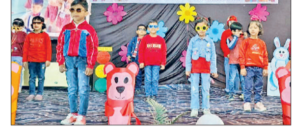
बहादुरगढ़। कार्यक्रम में प्रस्तुति देते नन्हे मुन्ने बच्चे।