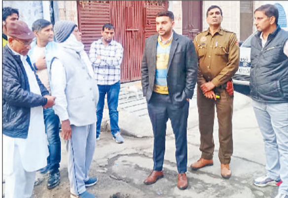
बहादुरगढ़। समस्या का जायजा लेने के लिए मौके पर पहुंचे एसडीएम।

निरीक्षण के दौरान संबंधित विभाग द्वारा ड्रेनेज लाइन की सफाई एवं अवरोध हटाने का कार्य तत्काल कराया गया, जिससे पानी की निकासी सुचारू रूप से बहाल हो गई। एसडीएम ने अधिकारियों को भविष्य में इस प्रकार की समस्या पुनः उत्पन्न न हो, इसके लिए नियमित निरीक्षण और