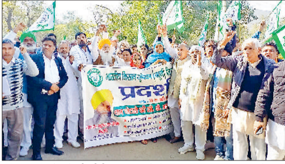
झज्जर। धान घोटाले की सीबीआई जांच को लेकर लघुसचिवालय परिसर में प्रदर्शन करते हुए किसान।