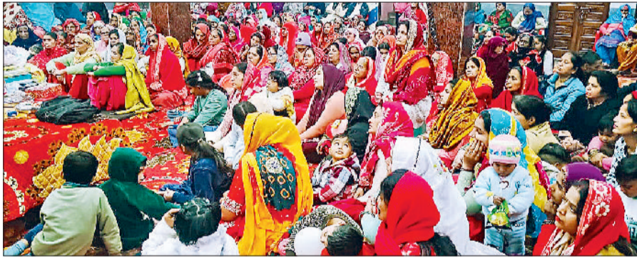
झज्जर। श्रीमद्भागवत कथा का श्रवण करते हुए श्रद्धालु।