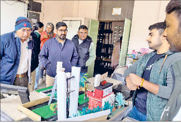
बहादुरगढ़। मॉडलों का अवलोकन करते शिक्षक।